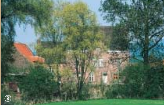
La Commanderie à Caëstre.

Faisant halte à Caëstre, un ancien camp militaire romain, les trois sœurs Edith, Elfride et Sabrina se seraient crues en totale sécurité. Tel ne fut pas le cas ! Voici la légende des Trois Vierges de Caëstre. La scène se déroule en 855. Trois jeunes sœurs d'origine anglaise, refusent la main de prétendants pour consacrer leur vie à Dieu. Elles décident d'entreprendre un pèlerinage vers Rome. En route, elles font escale à Caëstre. C'est là qu'elles sont sauvagement assassinées par trois brigands, peut-être les chevaliers éconduits. Un seigneur aveugle résidant non loin du drame, aurait eu alors l'apparition de la Vierge Marie lui demandant de se rendre sur les lieux du crime, en s'aidant du cri des oiseaux. Sur place, il se serait humecté les paupières du sang des victimes et aurait retrouvé la vue. Il aurait, en l'honneur de la Vierge Marie et des trois martyres, fait édifier la chapelle. Légende ou pas, les fondations