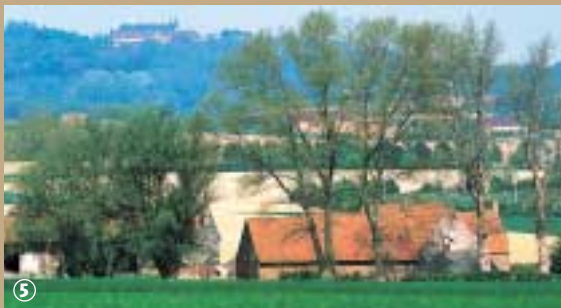
Mont des Cats vu de Caëstre.

lieu de pèlerinage sous l'Ancien Régime, tandis qu'un nouveau clocher l'abrite depuis 1887. Retrouvez le récit de cette légende à l'intérieur même de l'église, à travers un vitrail et un tableau du XIX e siècle, copie d'une œuvre probablement disparue à la Révolution.