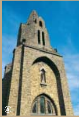
Chapelle des trois Vierges à Caëstre.

architecturales prouvent que la chapelle existe au moins depuis le XI e siècle ; celle-ci devint un haut