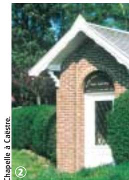
Chapelle à Caëstre.