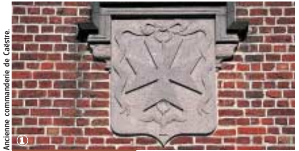
Ancienne commanderie de Caëstre.